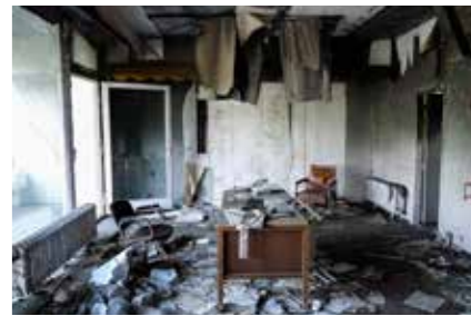
Verlaten Iraakse ambassade