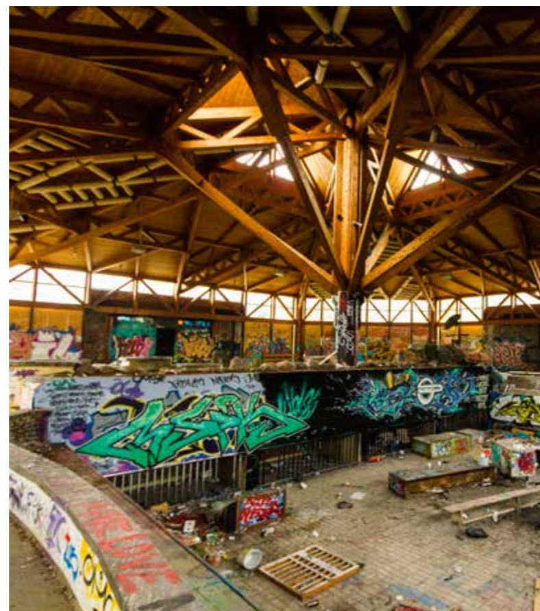
GRAFFITI Zwembad 'Blub' (Berliner Luft- und Badeparadies)

interesseerden een paar tientjes betalen, zorgt gozknaw dat er geen ongenodigde gasten op het terrein komen. Op die manier zijn het sanatorium Beelitz-Heilstätten en een Oost-Duitse vleesverwerkingsfabriek op legale manier toegankelijk. Daar is vaak meer te zien van de oorspronkelijke functies van de gebouwen. Zo staan in de fabriek een kegelbaan voor het personeel en kuipen waarin vlees werd behandeld.