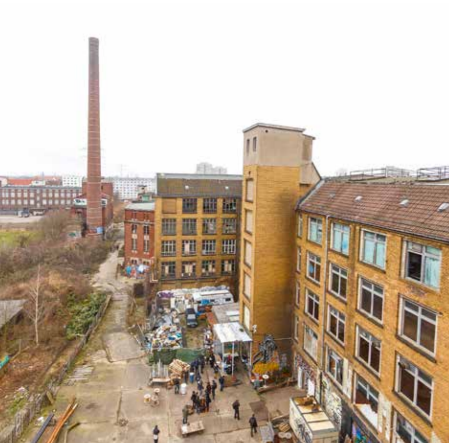
INDUSTRIE Oude vleesfabriek in Oost-Berlijn is geliefd bij urbexers