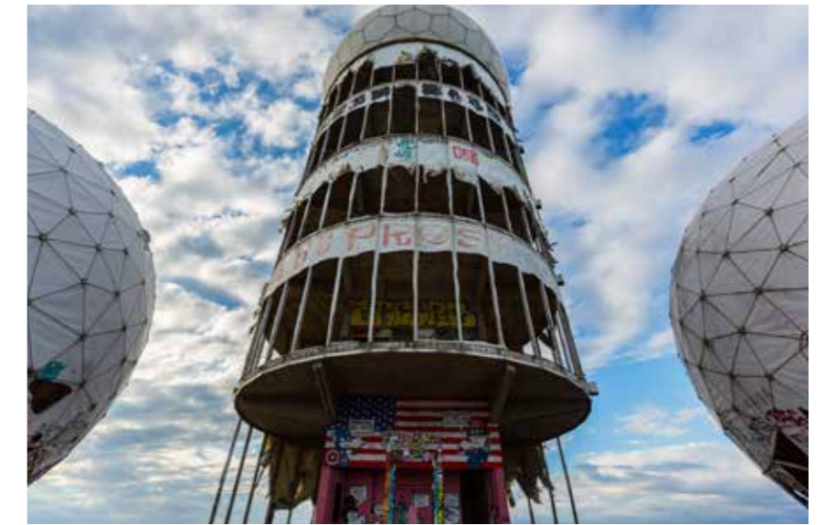
RADARKOEPELS Op de top van de Teufelsberg ligt het oude af luisterstation van de Amerikanen. Inmiddels trekt het naast avonturiers ook gewone dagjesmensen aan

Bij een open strook tussen de bomen, waar vroeger een hoogspanningshek stond, wijst hij op een groene heuvel. Daaronder ligt de bunker