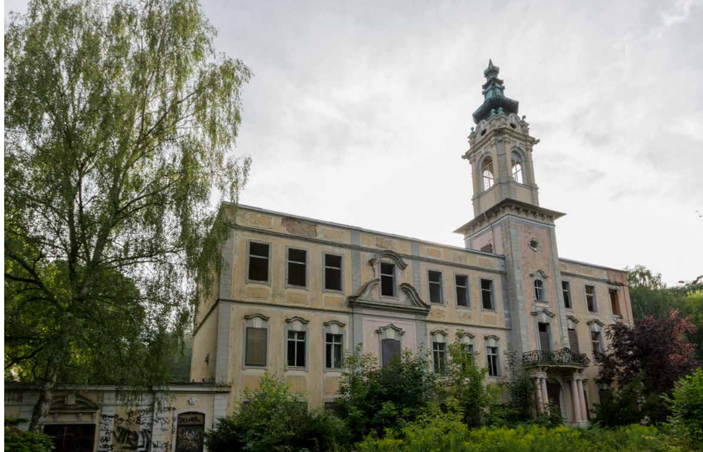
VERLATEN Schloß Dammsmühle, het voormalige hoofdkwartier van de Stasi

Om de aftakeling te stoppen, richten verschillende bedrijfjes zich op een tussenvorm van urban exploring . De personen achter go2know bijvoorbeeld gaan op zoek naar verlaten panden en nemen contact op met de eigenaars. In ruil voor exclusieve toegang voor fototours, waarvoor ge-