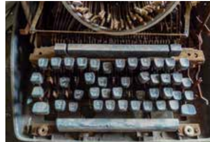
Typemachine in Iraakse ambassade