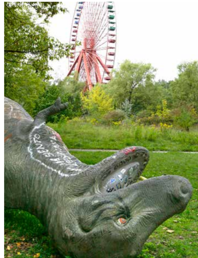
DINOSAURUS De overblijfselen van pretpark Spreepark