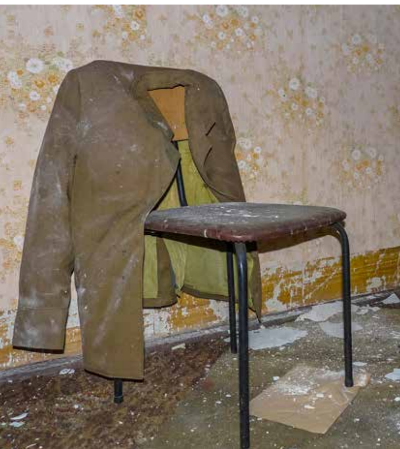
DDR-STIJL Krampnitz-kazerne in stadsdeel Pankow